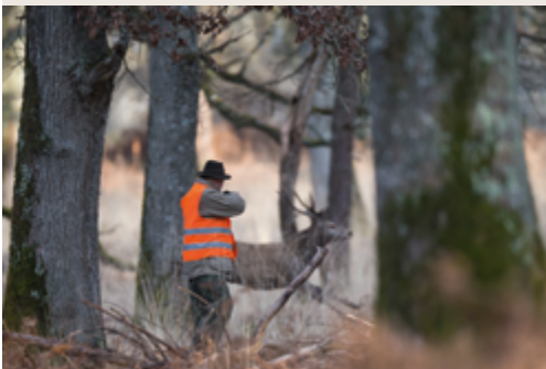
Ouverture de la chasse - Mémento - 2024-2025

Si l'animal est mort ou blessé, il est souhaitable que tous les chasseurs entendant l'annonce, la répète, afin d'éviter tout dépassement de plan de chasse.